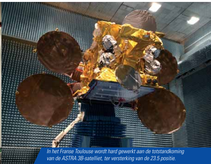
In het Franse Toulouse wordt hard gewerkt aan de totstandkoming van de ASTRA 3B-satelliet, ter versterking van de 23.5 positie.