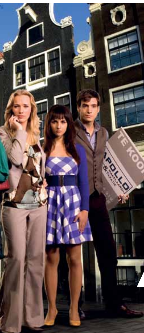
De cast van Verborgen Gebreken, de nieuwe drama-serie op NET 5 over Amsterdamse makelaars die in HD is gedraaid.

Technisch en productioneel is SBS er helemaal klaar voor. Ook is de zender bezig met de ombouw van de eindregie. SBS heeft het voornemen om met NET 5 te beginnen in HD. Buitenlandse series koopt SBS nu al aan in HD en ook eigen series – zoals Verborgen Gebreken – worden al gedraaid in HD. Nu moet het commerciële deel nog rondkomen; SBS is daarover in gesprek met de distributeurs, waaronder kabel-aars en CanalDigitaal. Als de kijker straks extra gaat betalen voor een HD-zender, vindt SBS het niet meer dan logisch dat de zender gecompenseerd wordt voor de extra investeringen. SBS hoopt en verwacht dat er nog dit jaar een akkoord is met de distributeurs. ■