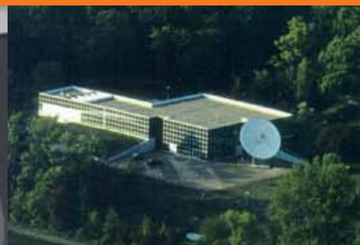
Het ASTRA grondstation in Betzdorf had in 1989 maar één uplinkschotel.