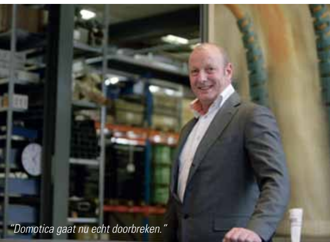
“Domotica gaat nu echt doorbreken.”

“Bedrijven in de zakelijke markt die willen dat internet en de telefoon het altijd blijven doen, kunnen ASTRA2Connect installeren als backup-systeem. Want KPN of de kabel ligt er nog wel eens uit, dat blijven kwetsbare infrastructures. Stel dat zo'n storing optreedt, dan neemt de satelliet het automatisch over. Kijk, dat is nu een van de grote voordelen van de satelliet: het werkt gewoon altijd.” ■